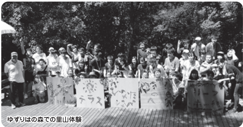
ゆずりはの森での里山体験

発達障害は、二十人に一人とも、十人に一人とも専門家の意見は違いますが、彼らの個性は才能であると思います。それを見つけて出す作業は、人によって違うため、かなりの時間がかかりますが、必ず解決への「道」「答え」はあると思っています。本人を変えようよりも周りの家族、学校現場の先生方がより深く努力し、寄り添って下さり、彼らが生きやすくなることを願っています。